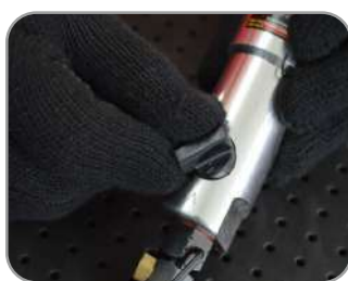
Seletor de sentido para aberto e desaperto