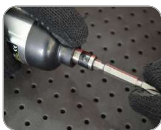
Encaixe com sistema de engate rápido

1 válvula auxiliar para controle de fluxo