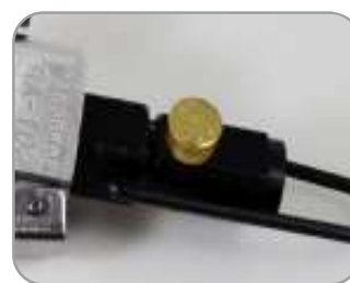
Válvula para controle de fluxo de ar